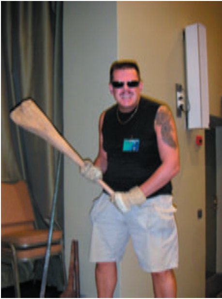
Kummisetä näyttää tuhoamisen mallia huutokaupassa.

lauantai 19.8.2006 toimitus: sekoilevat Robert E. Howardin jälkeläiset